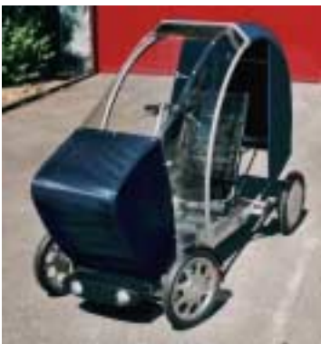
Ultraleichtmobil-Prototyp: Erste Applikation der elektronischen Transmission

Autork ltd. wird Fahrzeughersteller mit elektronischen Transmissionen beliefern. Die Transmission besteht aus mit elektrischen Kabeln verbundenen Modulen.