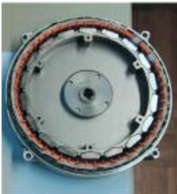
Elektrische Maschine von Circle Motor AG

Die Grafik oben zeigt, dass das Verhältnis von Wertschöpfung zu Investitionen für kleine Fahrzeuge, z.B. E-Fahrräder, optimal ist. Entwicklung von Technologien oder Komponenten ist noch interessanter als Entwicklung von gesamten Fahrzeugen, weil sich auch Anwendungsfelder ausserhalb des Fahrzeugbereichs öffnen können. Beispielsweise dienen die im Rahmen dieses Projektes als Generator identifizierten elektrischen Maschinen potentiell in einer Vielzahl von Anwendungen als Motoren! Während – wie die Geschichte des Smart zeigt – für die Realisation von Automobilen grosse Partner notwendig sind, können im Espace Mittelland KMU's Weltspitzenleistungen vollbringen und Hightech-Fahrzeuge und -Komponenten selber oder im Rahmen von Netzwerken realisieren.