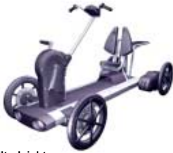
Ultraleicht- mobil Design