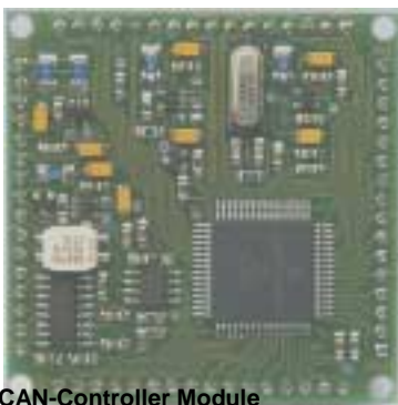
CAN-Controller Module von autork ltd./HTA Bern

Zwei Firmen sind initiiert und gegründet worden: