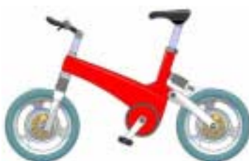
Active Bike von Harald Kutzke