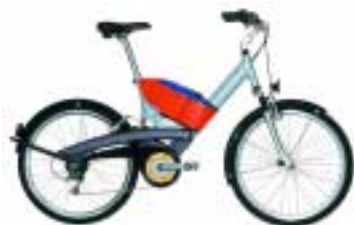
Beispiel eines modernen Elektrofahrrad: New Flyer